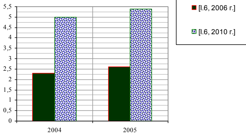
Коэффициент обновления основных фондов (в сопоставимых ценах) в обрабатывающих производствах, проценты.

Департамент информации Счетной палаты, конец 2010 г.: «Анализ показал, что износ основных фондов в отдельных отраслях промышленности достигает 80%... По сравнению с 1970 годом средний возраст оборудования отечественной промышленности увеличился почти в два раза. В 1970-м 40,8% мощностей имело возраст до пяти лет, а в настоящее время - лишь 9,6%» [262].