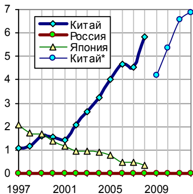
Производство копировальных аппаратов, млн. шт. Китай* - производство Xerox and Hectograph Printing Equipment, млн. шт. Источники: [I.6]; National Bureau of Statistics of China; Japan Statistical Yearbook.

Дополнительную информацию см. на сайте http://refru.ru