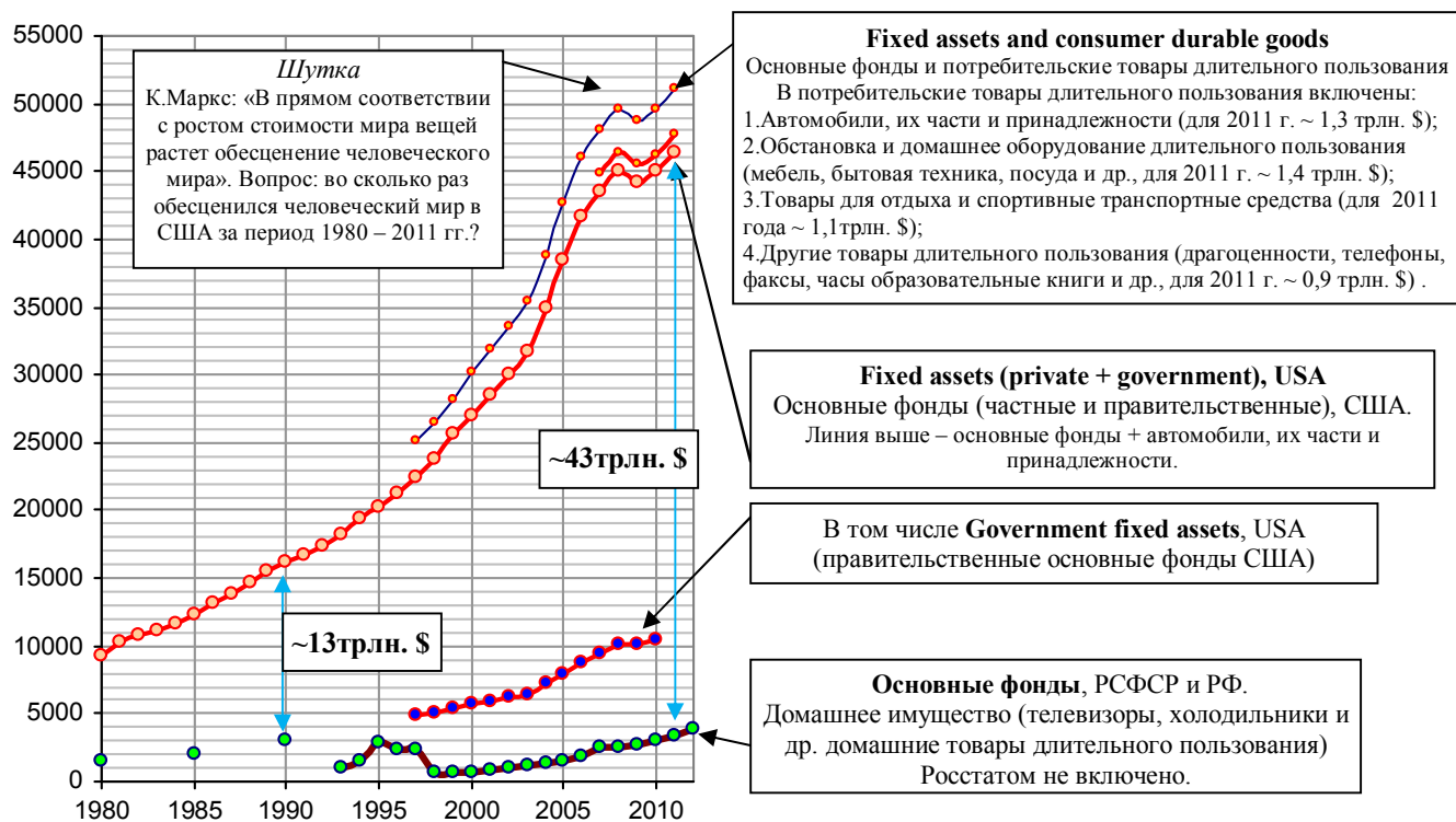
Основные фонды по полной учетной стоимости на конец года в России, стоимость основных в США в текущих ценах на конец года, млрд. долл.

Дополнительную информацию и список литературы см. на сайте http://refru.ru